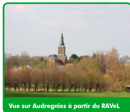
Vue sur Audregnies à partir du RAVeL

Mais le rôle du Parc naturel ne s'arrêtera pas là. Cette ancienne ligne de chemin de fer, véritable couloir écologique devra être réhabilitée. La voie verte réalisée par nos amis français dans l'Avesnois peut d'ailleurs nous inspirer.