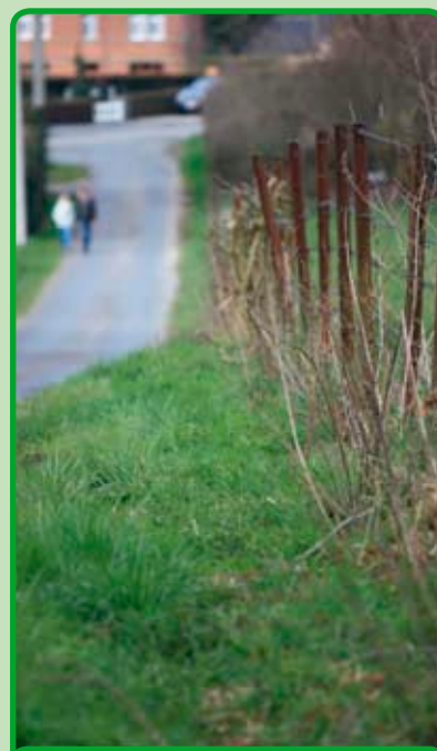
Plantation réalisée par le Parc naturel cet hiver

Nous ne manquerons pas non plus de vous tenir informés de la suite du projet dans les prochains numéros du Journal du Parc.