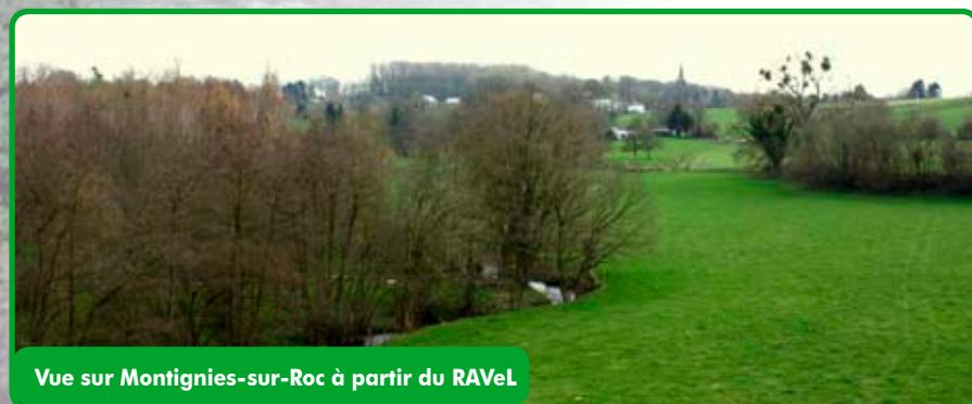
Vue sur Montignies-sur-Roc à partir du RAVeL