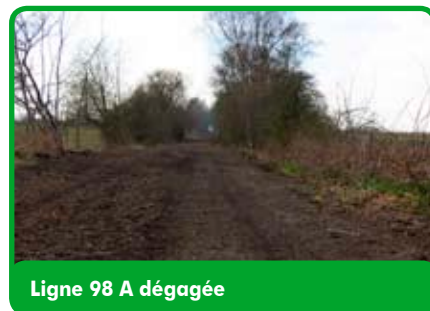
Ligne 98 A dégagée

Nous vous invitons donc à la lecture du texte présentant le sauvetage significatif de ce noyer sauvé des eaux, symbole de l'action entreprise par notre Parc naturel dans le cadre du projet de RAVeL sur la ligne 98A (Dour-Roisin).