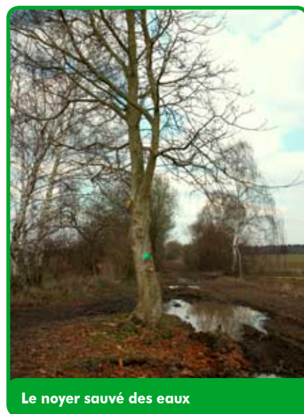
Le noyer sauvé des eaux

Grâce à l'action du Parc naturel en parfaite collaboration avec le Service Public de Wallonie (DGO1), un marquage des arbres à préserver fut entrepris, et la piste déviée en cas d'absolue nécessité. De plus, le débroussaillage de certaines parties du RAVeL offrant de très beaux panoramas aux marcheurs fut également réalisé.